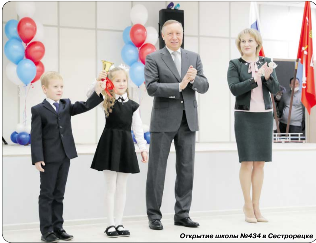
Открытие школы №434 в Сестрорецке

Одной из самых больших проблем города на Неве было затянувшееся строительство объектов образования. Именно об этом жители с возмущением говорили губернатору на встречах, направляли письменные обращения. Мнение петербуржцев не осталось без внимания – Александр Беглов взял проблемные стройки под личный контроль, строго спрашивал с чиновников и строителей.