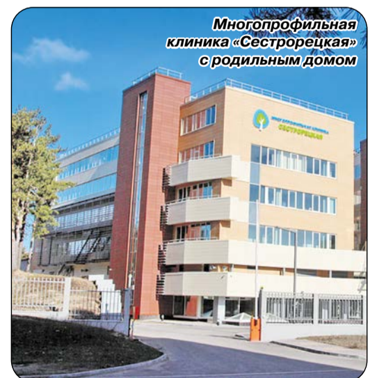
Многопрофильная клиника «Сестрорецкая» с родильным домом