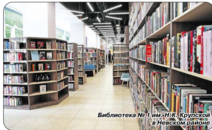
Библиотека № 1 им. Н.К. Крупской в Невском районе

Открытие Докового моста через Петровский канал в Кронштадте стало одним из наиболее значимых событий 2019 года – сквозное движение по нему с восстановлением маршрутов общественного транспорта было открыто в сентябре. Годом позже в Красносельском районе вступил в строй Гореловский путепровод : этого события жители ждали много лет – объекту крупно не повезло с обанкротившимся подрядчиком.