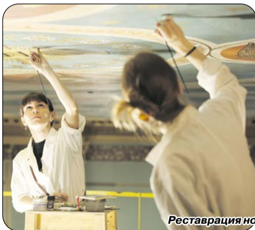
Реставрация новой площадки Музыкального театра им. Ф.И. Шаляпина