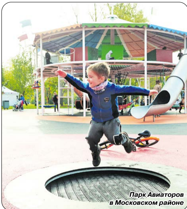
Парк Авиаторов в Московском районе

открыты спортивный комплекс с ледовой ареной и городской центр баскетбола, а также молодежное пространство для экстремальных видов спорта «Дунайский путепровод»; завершено строительство 9-этажного дома для пожилых (в рамках адресной инвестпрограммы); построено здание для размещения отделения экстренной медицинской помощи НИИ им. И.И. Джанелидзе; начали работу три детских сада; благоустроен парк Героев-пожарных.