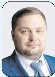
График приёма жителей депутатами Муниципального совета города Сестрорецка

Глава муниципального образования – председатель Муниципального совета города Сестрорецка