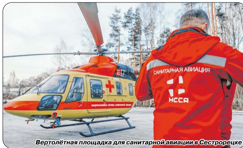
Вертолётная площадка для санитарной авиации в Сестрорецке

в центре социального обслуживания открыто два отделения ухода на дому для граждан пожилого возраста и инвалидов.