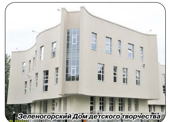
Зеленогорский Дом детского творчества

Кроме открытия спортшколы, значимым событием для жителей Пушкинского района стало начало работы ледовой арены «Пулково» и физкультурно-оздоровительного комплекса с бассейном. А еще – строительство одной из самых больших в Питере школ на 1925 мест в поселке Шушары. Там же было создано новое общественное пространство – сквер Николая Ивасюка.