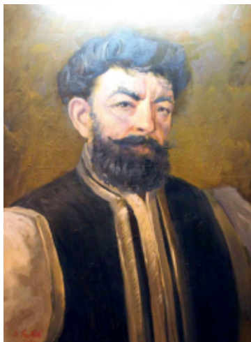
МИХАИЛ ИВАНОВИЧ ТАТАРИНОВ

ухудшилось после боя на реке Кагальник. Там казаки наголову разбили четырёхтысячный отряд османских войск, пришедший на помощь азовскому гарнизону из крепостей Керчи, Тамани и Темрюка. В довершение всего казачья флотилия надёжно заблокировала устье Дона со стороны Азовского моря.