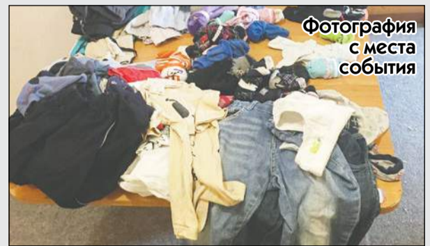
Фотография с места события