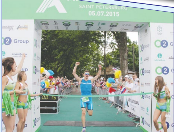
ТРИАТЛОН ВОЗВРАЩАЕТСЯ СТР.3