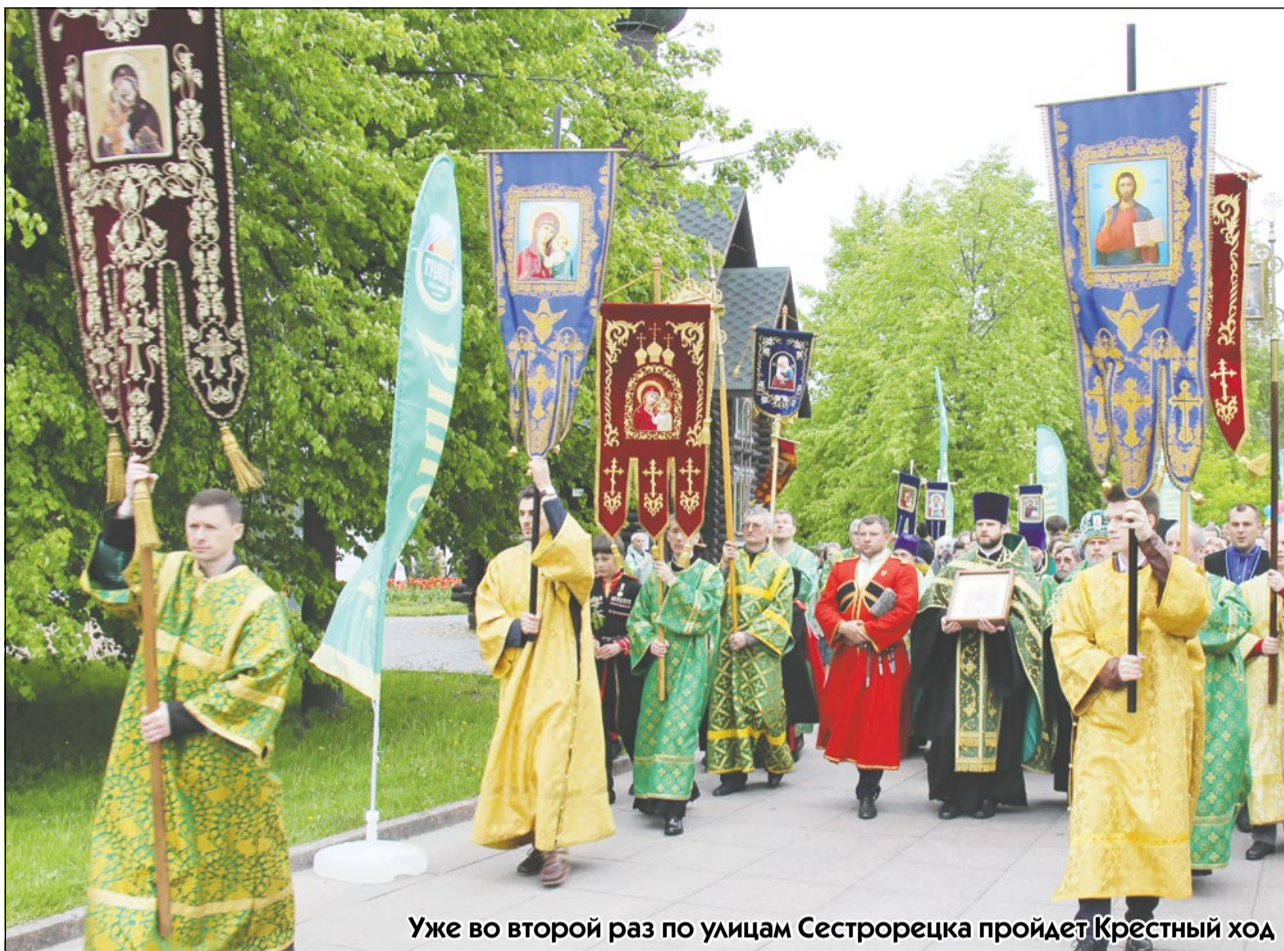
Уже во второй раз по улицам Сестрорецка пройдет Крестный ход