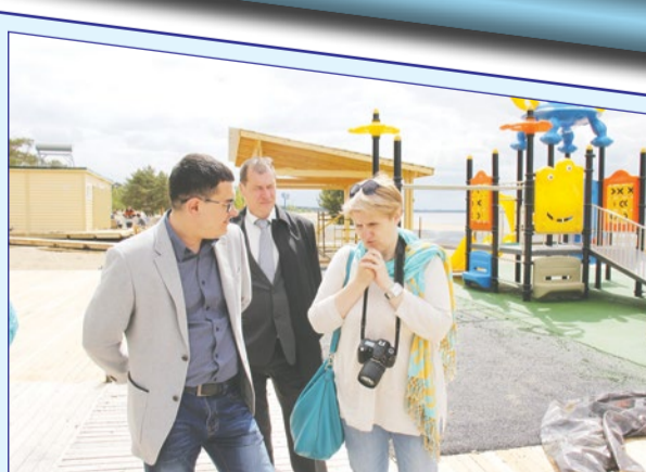
НА КОЛЯСКЕ БЕЗ БАРЬЕРОВ СТР.6