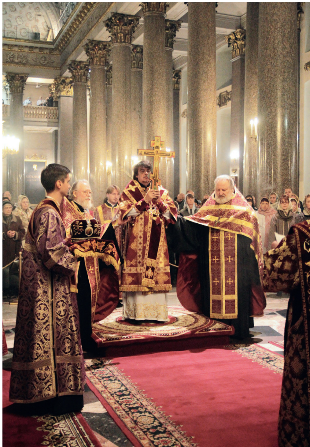
Чин воздвижения Креста. Казанский собор. 26 сентября 2014 г.