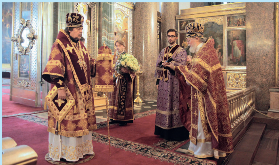
епископа Царскосельского МАРКЕЛЛА (27 сентября)!

В праздник Воздвижения Честного и Животворящего Креста Господня, 27 сентября, епископ Царскосельский Маркелл по благословению митрополита Санкт-Петербургского и Ладожского Варсонофия возглавил служение Божественной литургии в Казанском кафедральном соборе.