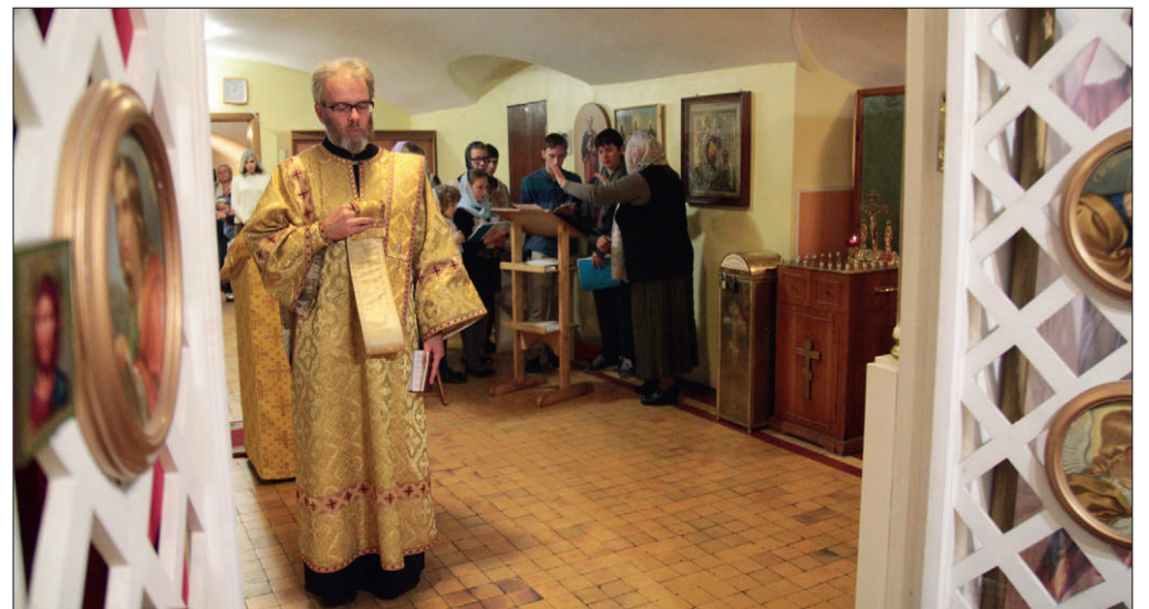
Литургия для детей в крипте Казанского собора. 14 сентября 2014 г.