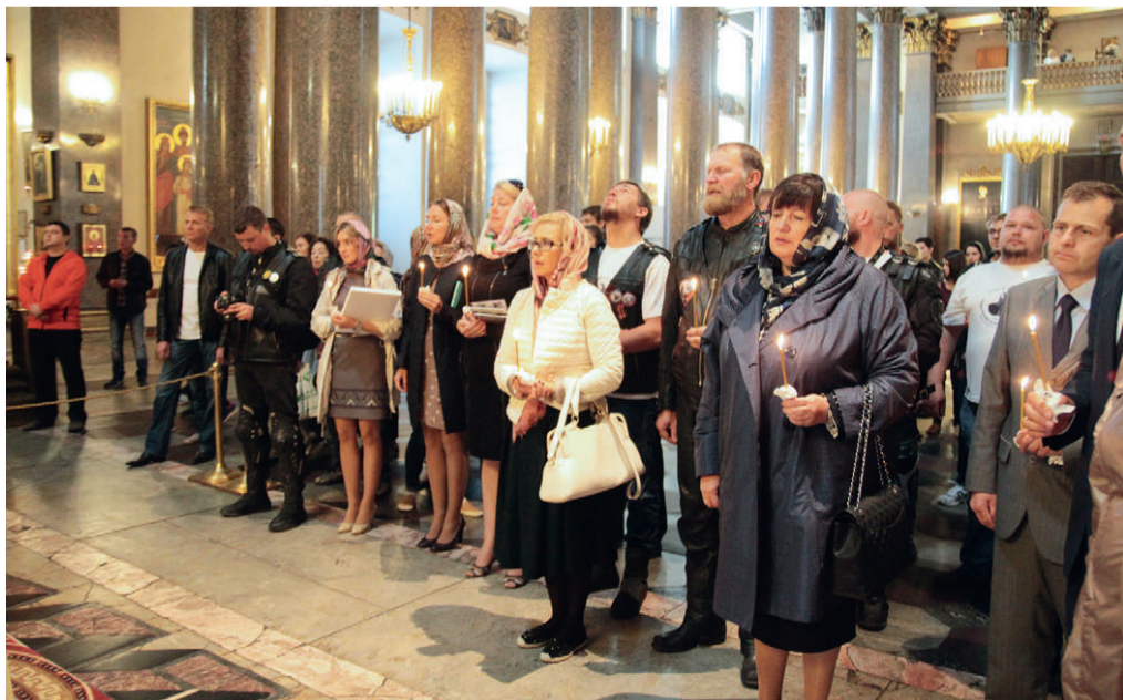
Благодарственный молебен. Казанский собор. 6 сентября 2014 г.