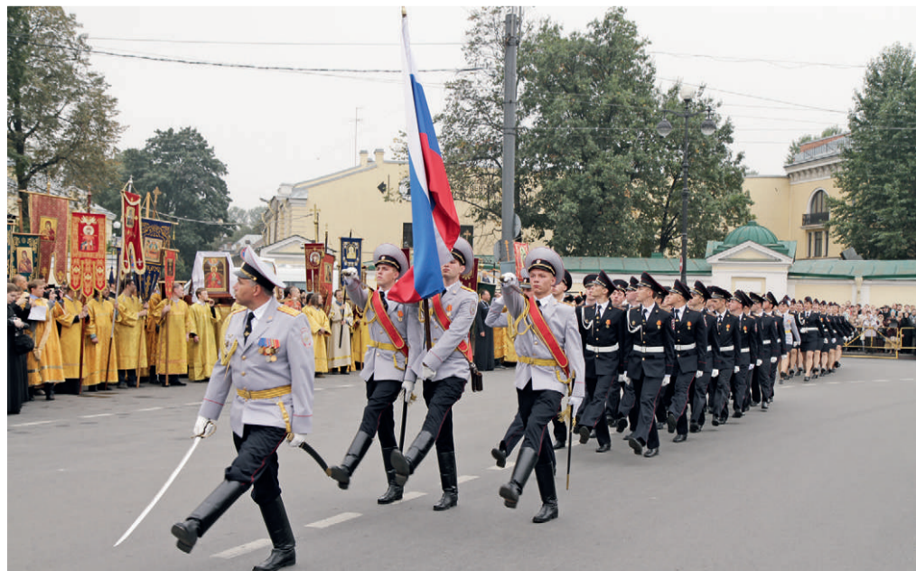
Празднование 290-летия перенесения мощей святого Александра Невского. Санкт-Петербург. 12 сентября 2014 г.