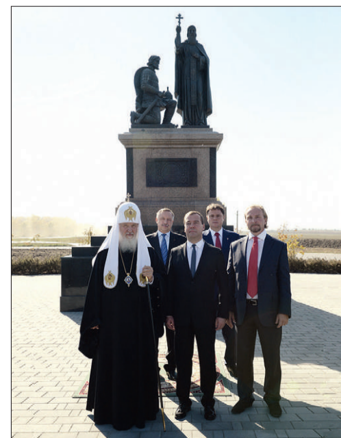
После освящения памятника преподобному Сергию Радонежскому и князю Димитрию Донскому на Куликовом поле. 21 сентября 2014 г.