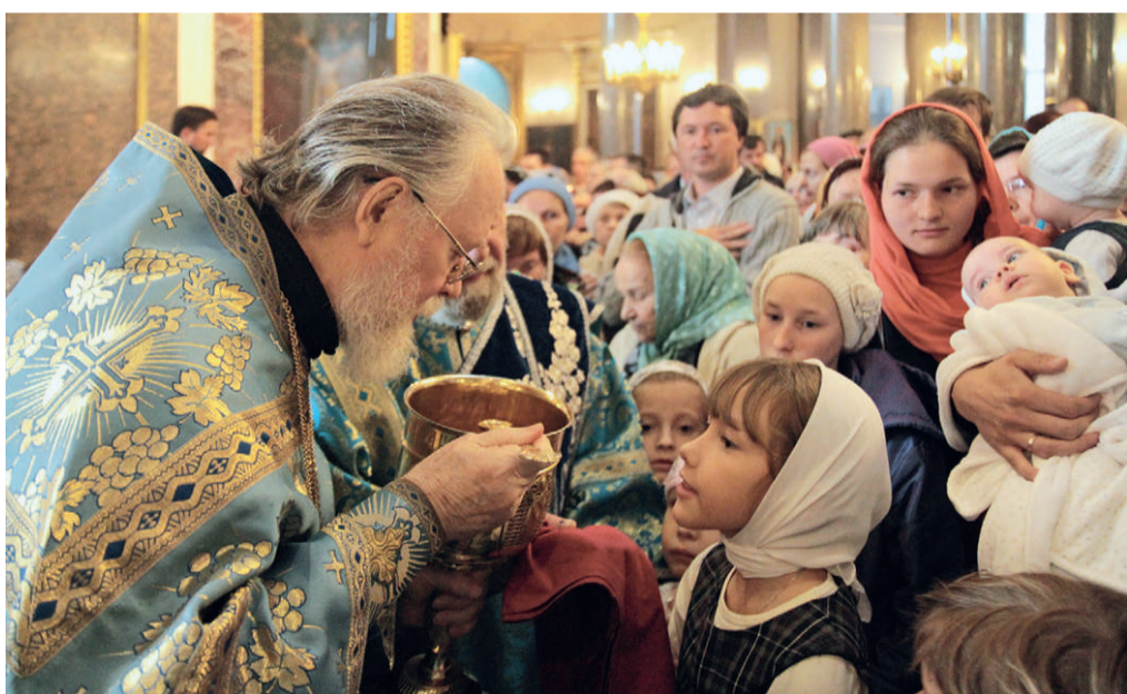
Праздник Рождества Пресвятой Богородицы. Казанский собор. 21 сентября 2014 г.