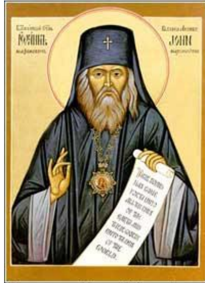
Святитель Иоанн Шанхайский