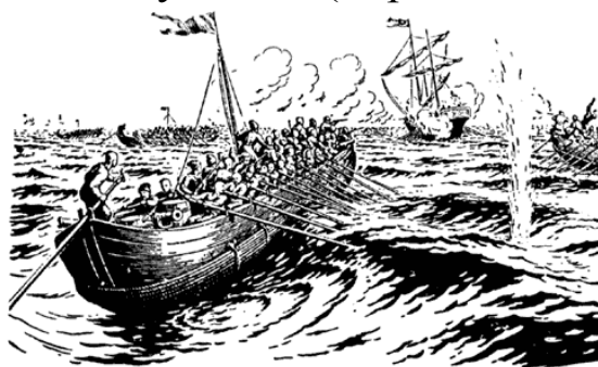
Казачьи чайки в бою

сухопутные и морские операции, все захваченное становилось общей собственностью – дуваном. ( http://www.ruguard.ru )