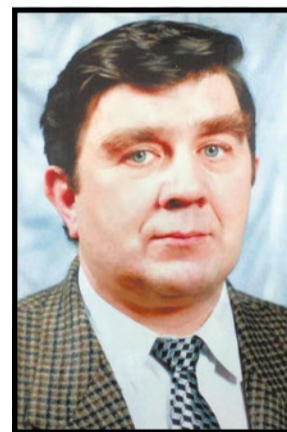
Депутаты Муниципального совета города Сестрорецка Сотрудники Местной администрации города Сестрорецка