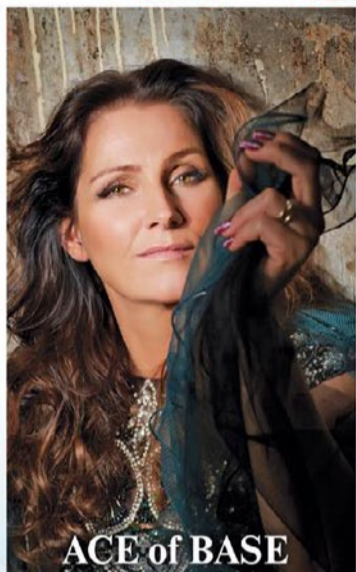
ACE of BASE