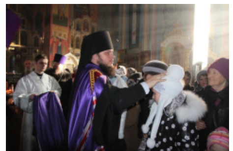
ПРЕСС-СЛУЖБА ХКО СДКО СКР