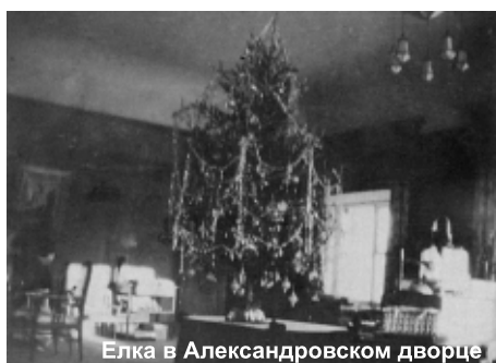
Елка в Александровском дворце