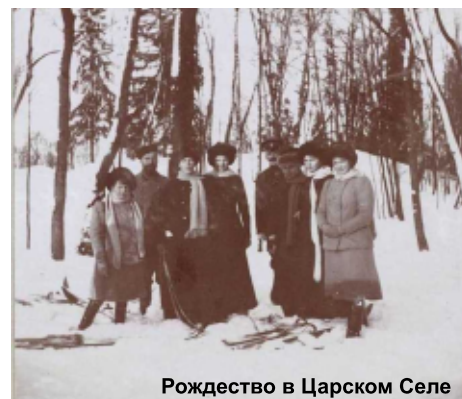
Рождество в Царском Селе

был в Петербург. Родители скрыли это от дочери, а на праздник презентовали его в качестве подарка. Ее сестре, великой княжне Ольге Николаевне, подарили рояль фирмы Вирт, картину, нарядные платья и браслет с сапфиром.