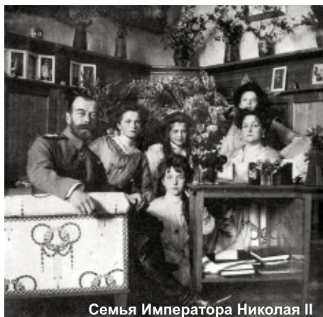
Семья Императора Николая II