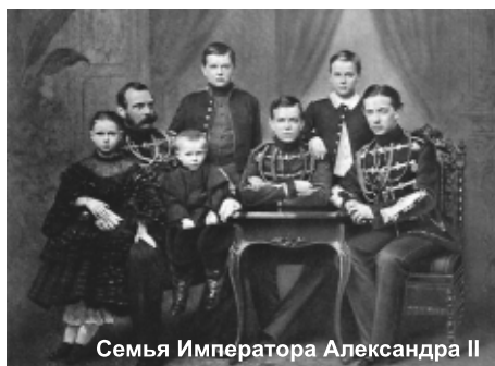
Семья Императора Александра II