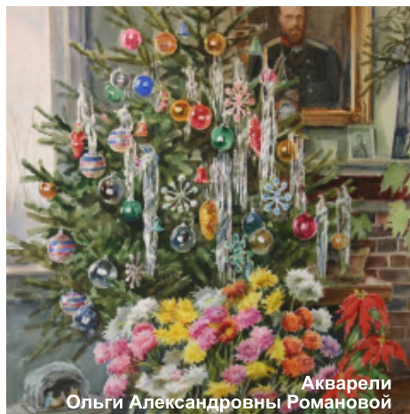
Акварели Ольги Александровны Романовой