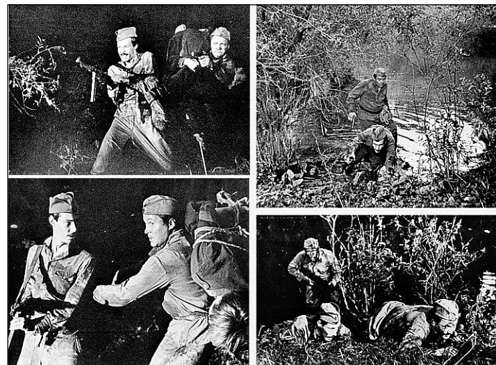
Сюжет, с которого начинался фильм, был посвящен фронтовой истории Шарапова и Левченко и полностью вырезан из финальной версии

Зато когда Говорухин вернулся, то съемочная группа встретила его словами: «Высоцкий нас измучил!»