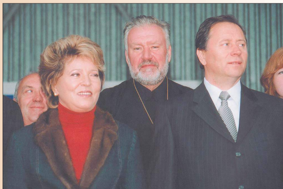
В праздновании 290-летия Сестрорецка приняли участие многие официальные лица, в том числе губернатор Санкт-Петербурга Валентина Матвиенко. Но юбилейные торжества были подготовлены так, чтобы главными участниками стали в первую очередь жители и гости города