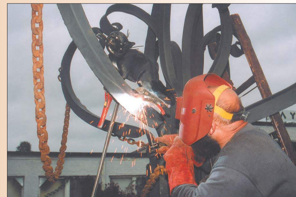
У входа в парк «Дубки» работали мастера Санкт-Петербургской гильдии кузнецов, которые ковали подарки для юбиляра — Сестрорецка