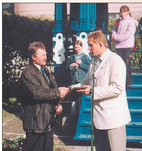
На пересечении Приморского шоссе и улицы Токарева состоялось торжественное открытие точной копии шляпинской беседки