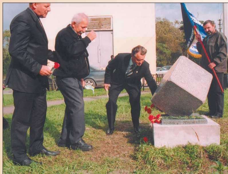
В 38-м квартале, рядом с домом 272 по Приморскому шоссе, 17 августа был установлен закладной камень на месте, где появится памятный знак жертвам радиационных аварий и катастроф