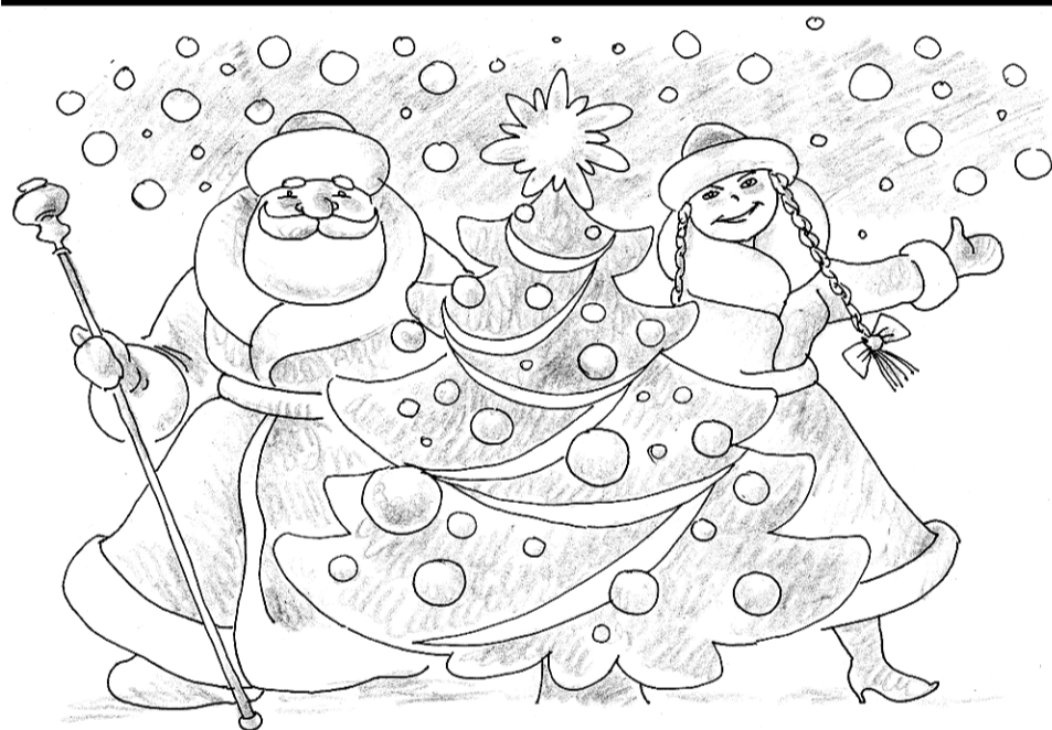
Рисунок Владислава ЮЖАКОВА

Затем собравшихся ожидает концертная программа, также будут колядки и чаепитие с огромным рождественским тортом.