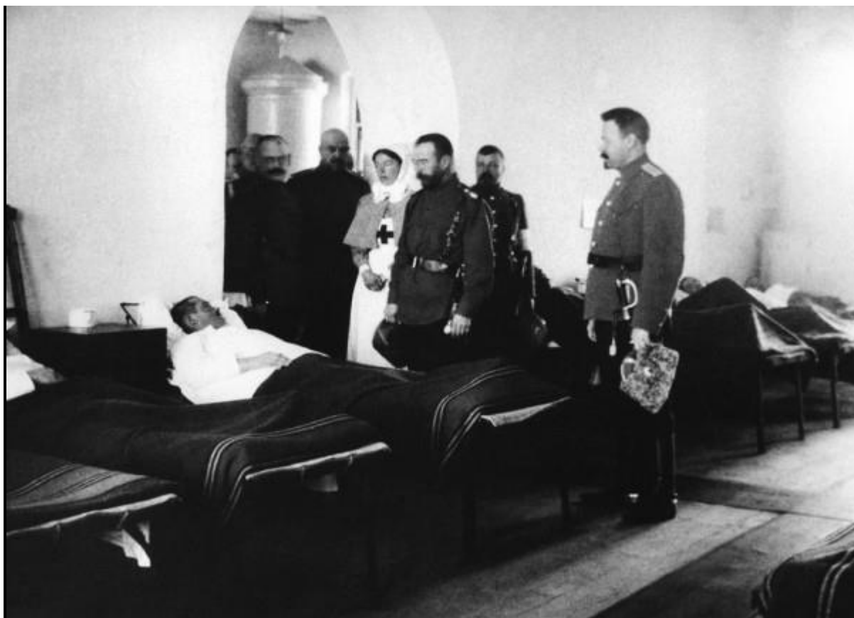
Император Николай II с дочерью в военном госпитале. 1915 год.