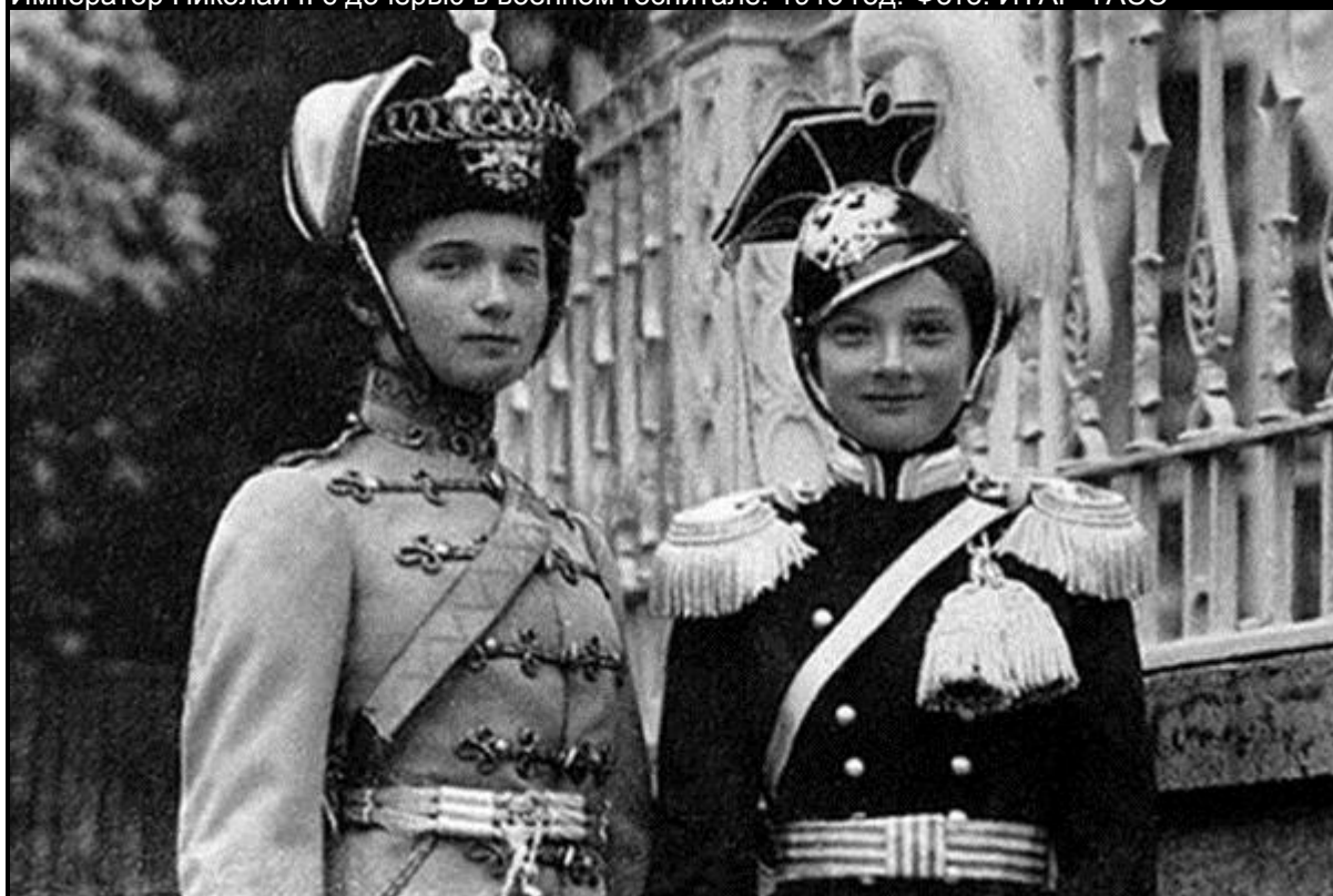
Великие княжны Ольга и Татьяна Николаевны в парадных мундирах "своих" подшефных полков. 1910 год.