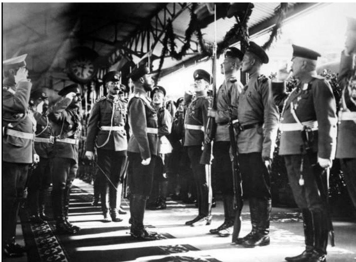
Император Николай II на перроне железнодорожного вокзала обходит строй почетного караула по прибытии в Москву. 1910 год.