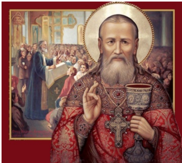
Святой праведный Иоанн Кронштадский (1829г. - 1909г.)

Сия книга «В Мире Молитвы» издана Комитетом Русской Православной молодежи за границей, как очередной вклад к 1000-летию Св. Крещения Русского Народа.