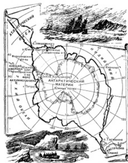
Карта маршрута экспедиции Ф. Ф. Беллинсгаузена и М. П. Лазарева вокруг Антарктиды