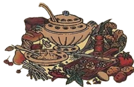
В следующем номере продолжим учиться варить каши.

огурцовъ, 5 столовыхъ или кухонныхъ ложекъ сметаны (по вкусу) и 5 чайныхъ ложекъ мелко рубленой и перетертой съ солью зелени укропа, петрушки и зеленого лука. Нарѣзавъ мелкими кусочками мясо, яйца и огурцы, кладутъ все это въ суповую чашку, солятъ и размѣшиваютъ съ приготовленной зеленью и сметаной, наконецъ, вливаютъ хлѣбный квасъ, кисляци или кипяченый съ сахаромъ и процѣженный сыровецъ, 10 - 12½ стакановъ. Приготовленную такимъ образомъ окрошку выносятъ на ледъ, чтобы она охладилась, а передъ подачей на столъ ее заправляютъ хрѣномъ, горчицей укссомъ или сахаромъ по вкусу и кромѣ того кладутъ въ нее куски льда.