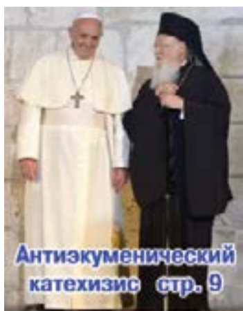
Антикуменийский катехизис стр. 9