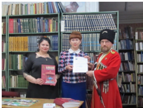
ПРЕСС-СЛУЖБА ХПКО СДКВ