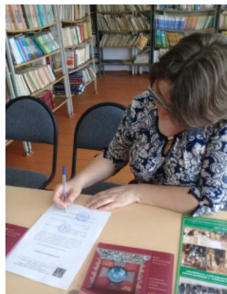
ПРЕСС-СЛУЖБА ХПКО СДКВ