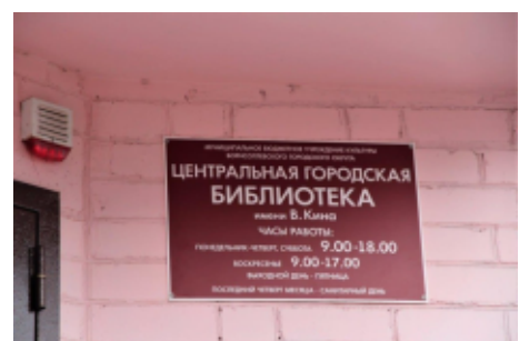
ПРЕСС-СЛУЖБА ХПКО СДКВ