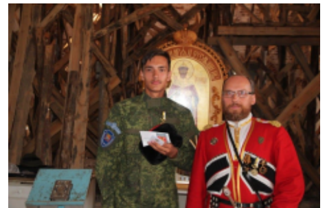
ПРЕСС-СЛУЖБА ХПКО СДКВ