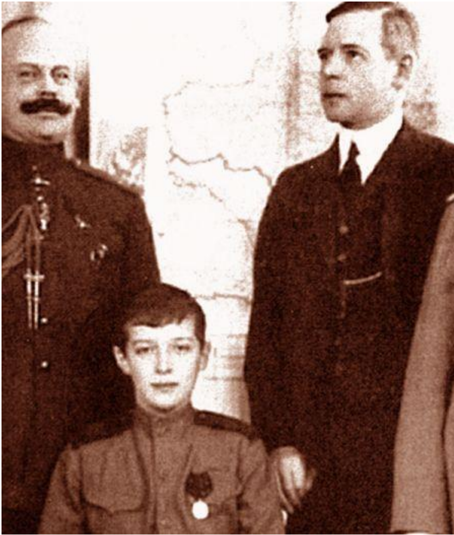
Ч. Гиббс и цесаревич Алексей.

После Февральской революции семья оказалась в Александровском дворце под домашним арестом. Дети лежали с температурой, накрывшись тулупами, потому что семье «отключили» электричество, тепло и даже воду, её приходилось брать из проруби. Николай II валил в парке сухие деревья и пилил их на дрова. В конце марта на дворцовой лужайке члены семьи вскопали огород, посадили овощи. С первого же дня заточения комиссия, назначенная Временным правительством, не переставала допрашивать царя и царицу. Но фактов, указывающих на государственную измену, обнаружить не удалось.