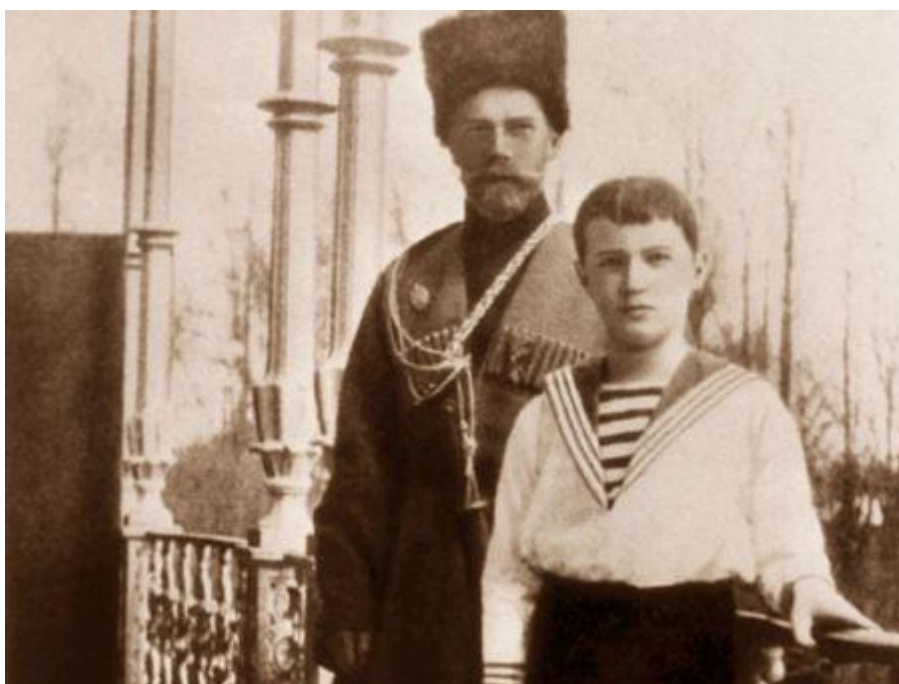
Николай II с сыном Алексеем.

Раненых княжон и царевича добивали штыками. Затем отвезли за 20 км от города, на Ганину Яму, где с помощью огня и серной кислоты избавились от трупов. Войска белых, а вместе с ними и Гиббс вошли в город вскоре после злодеяния. Чарльз помогал следствию восстановить обстоятельства преступления, слушал показания свидетелей. На Ганиной Яме вместе с обронённой серёжкой, отрубленным пальцем и лоскутами одежды Сид увидел обрывок разноцветной фольги из детского набора, которую цесаревич любил носить в кармане. На секунду Чарльз зажмурился... Затем достал из кармана потрёпанный листок со стихотворением, которое княжны часто перечитывали в последнее время, а на одном из уроков перевели на английский. В конце было: «И у преддверия могилы Вдохни в уста Твоих рабов Нечеловеческие силы Молиться кротко за врагов».